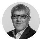
Eric Nussbaumer Vice-président Conseil National

25 e anniversaire de la Fondation Ethos Jeudi 9 juin 2022, Kursaal, Kornhausstrasse 3, Berne